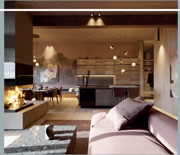
Design trifft alpinen Lifestyle