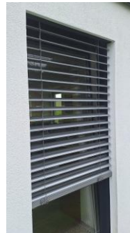
Schaubild Raffstore gewendet

Raffstore Leerkasten inkl. Elektro Leerschlauch enthalten (Behang als Sonderwunsch möglich)