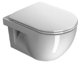
Wand WC+ Herstellung Leerschlauch für Dusch-WC