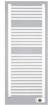
Badheizkörper elektr. (SW gegen Aufpreis möglich)