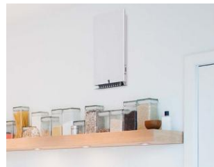
Innenansicht (Maße ca. 30x 63cm)

dezentrales Lüftungsgerät „bluMartin freeAir 100e“, mit Wärmerückgewinnung im Wohnraum in der Außenwand montiert (Bereich Loggia) und damit verbundene Tellerlüfter in Schlafzimmer, Kinderzimmer, Bad und WC in der Decke.