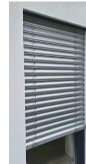
Schaubild Raffstore geschlossen, blickdicht