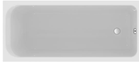
Körperformwanne Acryl, 175 x 75cm