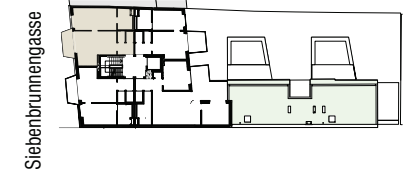
Grundriss 3. Obergeschoss